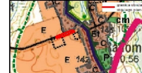
Wyrys ze Studium uwarunkowań i kierunków zagospodarowania przestrzennego gminy Nowe Miasto Lubawskie skala 1:25000